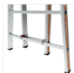
2 crochets du plan supérieur se placent sur les échelons du plan inférieur