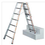
Travail possible sur sol plat, escalier et terrain dénivelé