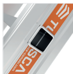
Ultra-résistance de l'échelon grâce au sertissage à double expansion