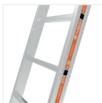
Échelons 30 x 30 mm