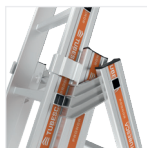
Ultra-résistance de l'échelon grâce au sertissage à double expansion