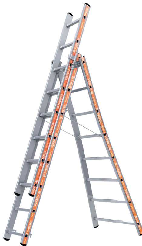
Modèle présenté : 01253008