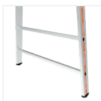
Base évasée pour plus de stabilité