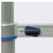
2 boutons poussoir pour replier l'échelle