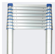
Hauteur ajustable selon les contraintes du chantier