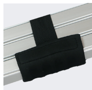
Poignées de confort pour faciliter le transport