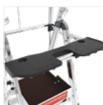
Tablette XL résistance 25 kg