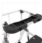
2 tablettes porte-outils amovibles interchangeables