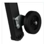
Roues de déplacement