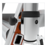
Système intuitif de repliement du garde-corps