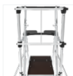
Garde-corps à lisses de protection antichute à fermeture semi-automatique