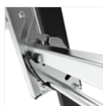
Bascule de réglage de la hauteur intuitif et sécurisé