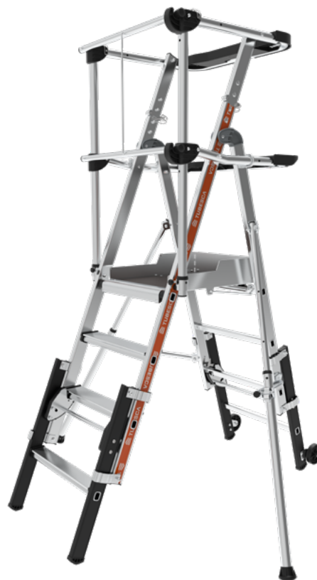
Modèle présenté : 02274921