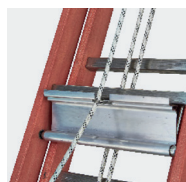
Basculeur d'enclenchement à mise en place automatique