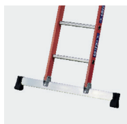
Embase pour plus de stabilité