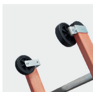
Roulettes de déploiement