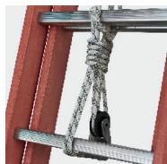
Corde traitée anti-U.V. pour résister au soleil et aux intempéries