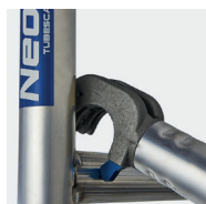
Système de liaison Ergoblock® breveté, blocage fiable d'un seul geste