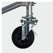
Roues diam. 200mm à blocage réglables sur 200mm et tous les 12,5mm