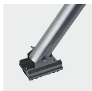
Platine de stabilisateur anti-dérapant orientable