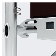
Crochets des plateaux ergonomiques