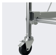
Roues Ø 125 mm. Blocage ultra-puissant des roues.