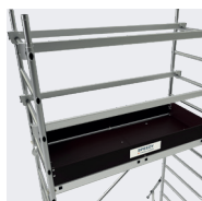
Montage rapide sans outils.