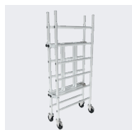
Base pliante compacte : 1,75 x 0,83 x 0,23 m