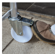
Montage rapide sans outil